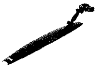
Mighty zadný blatník

Jednoduchý zadný blatník s kľbovým nastavením